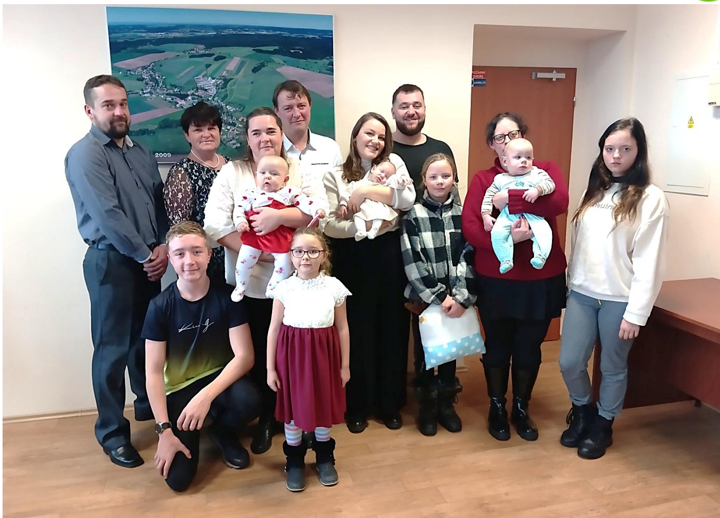
Vítání občánků.