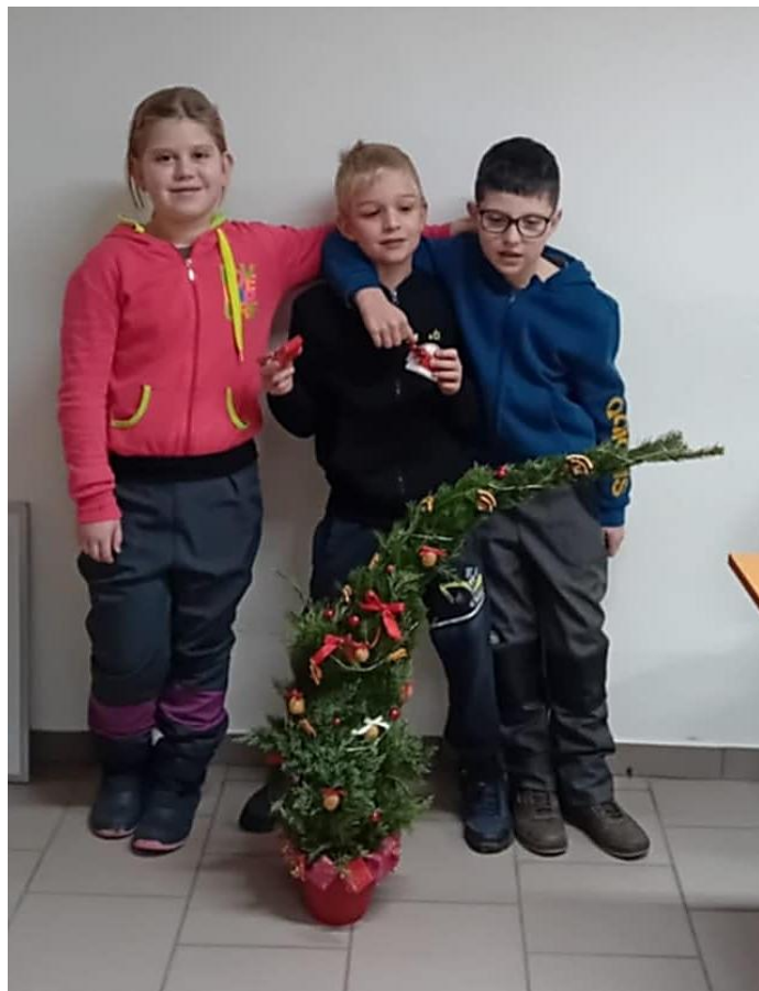
Vítězem soutěžní výstavy „Bez stromečku nejsou Vánoce“ se stal ČZS Pohled. Krásný trpasličí stromeček našich mladých hasičů skončil na sdíleném 17. - 19. místě. Děkujeme.

Jan Ondráček honební starosta mobil: 724 045 480