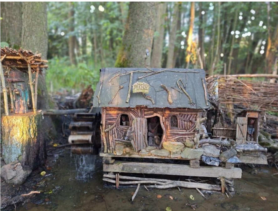
Soutěžní snímek Janičky Zvolánkové, s kterým se umístila na krásném 3. místě v soutěži "S OBJEKTIVEM PO KRÁSÁCH MAS HAVLÍČKŮV KRAJ".