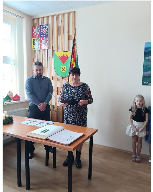
Pani starostka s panem místostarostou přivítali nové občánky.