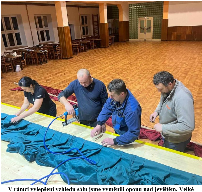
V rámci vylepšení vzhledu sálu jsme vyměnili oponu nad jevištěm. Velké poděkování patří Pavlíně Blažkové za návrh a zajištění, Janě Bačkovské za přípravu a ušití a ostatním za realizaci.