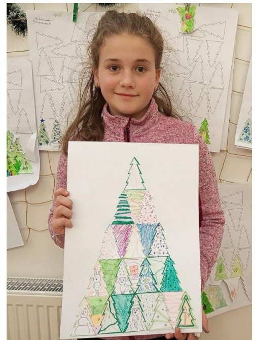
Vyrábění ve školní družině.